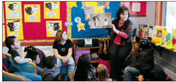
En Reedville se emplea el currículo Second Step, para ayudarles a los estudiantes a resolver problemas sin enojo, resultando en un ambiente más respetuoso en la escuela.

Desde el momento en que los estudiantes llegan a la escuela, hasta el momento que regresan a sus hogares, el Distrito Escolar de Hillsboro y Tobias, hacen que la seguridad sea una prioridad. Algunas de estas prácticas son iguales a las que recordamos cuando estábamos en la escuela. Los simulacros de incendio son un ejemplo, pero Tobias ha tomado un paso adelante. Durante los días de simulacro de incendio, todos los maestros re-