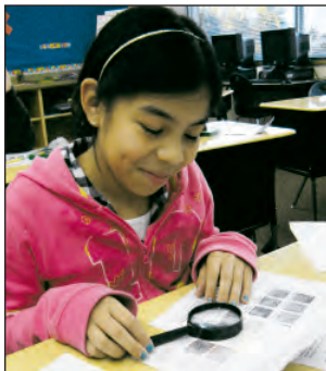
El Club CSI Forensics, es solo una de las muchas actividades para después de clases, ofrecidas por la Escuela Comunitaria Free Orchards de Camp Fire.

El mes pasado, nuestro PTO ofreció una divertida noche de bingo y de rifas. Cada salón rifó una canasta de premios y golosinas. Las ganancias de este evento van para la compra