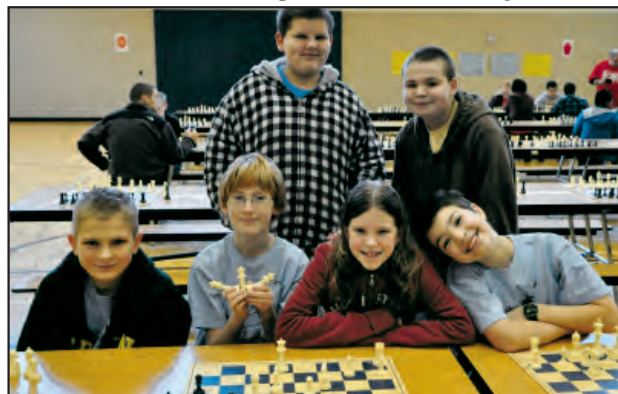
Los miembros del equipo de ajedrez de Eastwood, desarrollaron estrategias y destrezas para competir con otros clubes.

Finalmente, nuestra cocina y cafetería son las más acogedoras del Distrito. Tienen las paredes llenas de decoraciones y obras de arte hechas por los estudiantes. Algunas de