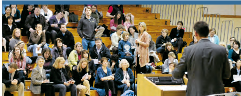
El Superintendente Mike Scott, se dirige a un grupo de más de 125 personas durante su Sesión de Audiencia del 17 de febrero en la Secundaria Evergreen. Allí él dio a conocer las categorías de las reducciones al presupuesto, que están en consideración, y respondió muchas preguntas de la audiencia. La próxima audiencia será el jueves 14 de abril de 6:15-8:30 p.m. en la Secundaria South Meadows.

*El nivel de servicio actual, es lo que le tomaría al Distrito en hacer exactamente las mismas cosas que está haciendo este año, en el próximo año; teniendo en cuenta los aumentos en PERS, las obligaciones de los contratos, los precios de los servicios públicos y del combustible, etc.