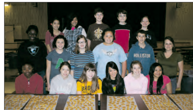
La Sociedad Nacional de Honor Junior de Brown, hace galletas naturales para perros, hechas a mano y las vende en el Mercado de Granjeros de Hillsboro, para recaudar fondos con destino al Albergue para Mascotas Bonnie L. Hays.

La próxima vez que vaya al Mercado de Granjeros de Hillsboro, busquen nuestro propio signo: Brown Honor Society (Sociedad de Honor Brown), ¡la forma inteligente de comprar galletas inteligentes, para perros inteligentes!