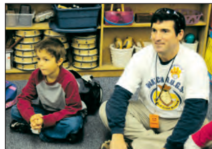
Los padres de los grandes estudiantes de Mooberry, Watch DOGS, se comprometen como voluntarios al menos un día por año escolar, incluso trabajando con grupos pequeños en los salones de clase.

¡En este número, Orenco presenta las áreas que hacen de nosotros una escuela destacada!